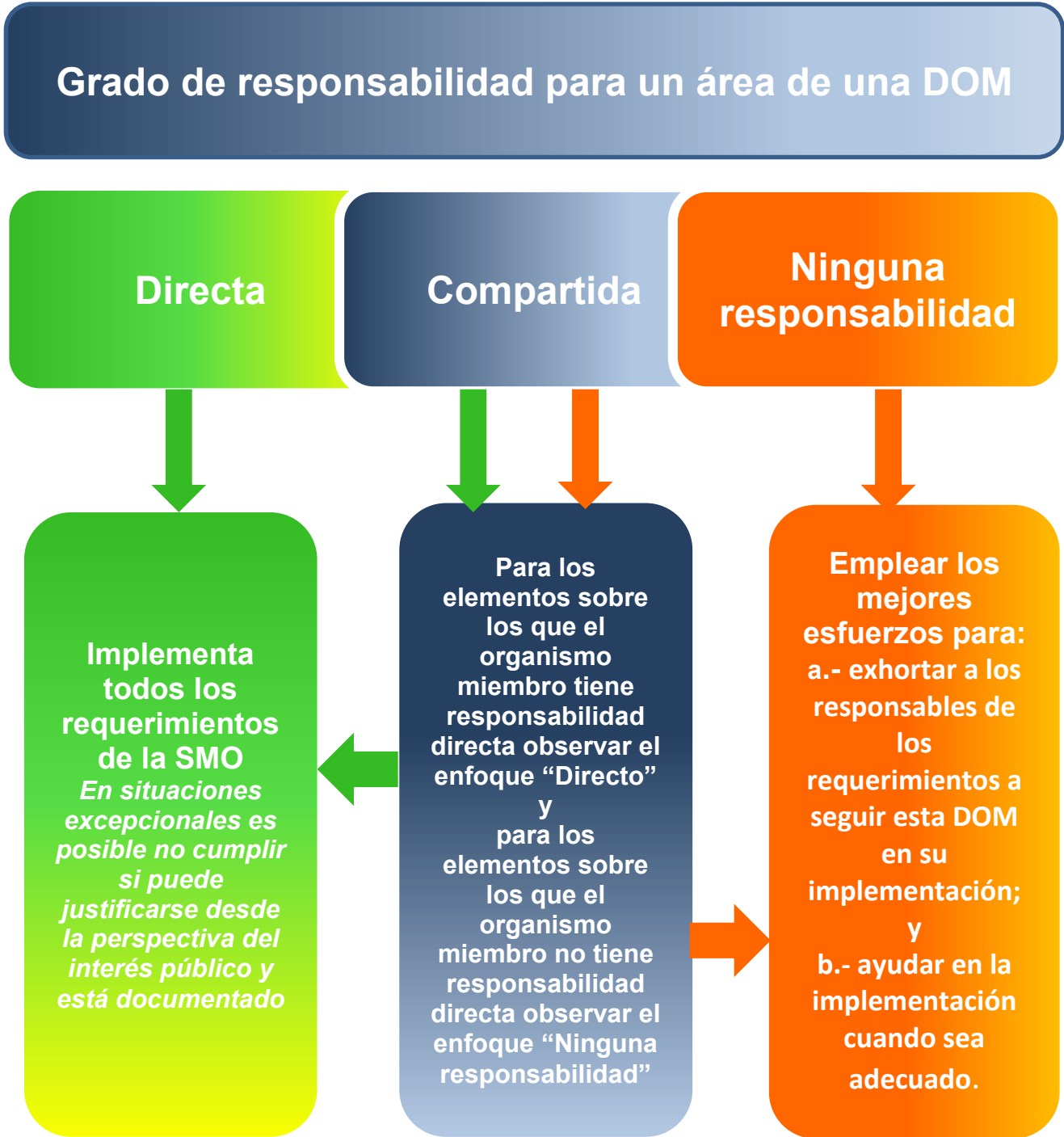
Diagrama 1 Ilustración sobre el Marco Aplicable